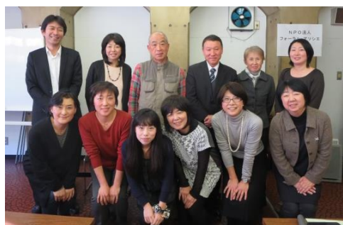
新しい理事・監事メンバーです

意思ある個人が緩やかにつながり行動するアソシエーション。その考え方や実践を地域に届けようと設立されたフォーラム・アソシエは、第13回通常総会（2016年4月26日開催）をもって発展的に解散しました。これに先立ち私たちはNPO法人フォーラム・アソシエを設立し、改めて会員を募り、今年4月新しくスタートいたしました。